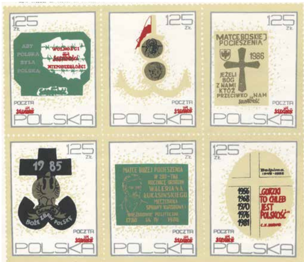
Wota złożone na mszach św. za ojczyznę w latach 1980-87 w kościele św. Klemensa Dworzaka przy Al. Pracy we Wrocławiu (ukazały się trzy serie takich bloczków)

Jednak to zaangażowanie internowanych szczegółowo będzie opisane w kolejnej książce. Tymczasem ten opisywany katalog zajmuje się przede wszystkim w miarę pełnym opisaniem tego, co stało się w latach 1980 – 86. Odpowiedź na pytanie dlaczego wówczas tak dużo powstało tych druków, wydaje się oczywista. Solidarność wypełniała białe plamy polskiej historii i dokumentowała także w ten sposób zbrodnie komunistycznej władzy. Pojawiające się w obiegu podziemnym znaczki miały walory propagandowe i były łatwiejsze do stworzenia niż gazетка czy książka. Rozprowadzano je jak cegiełki, które służyły do tego, by zdobyć pieniądze na działalność konspiracyjną. Ciekawostką może być to, że niektóre egzemplarze znaczków wysyłane przez osoby prywatne przeszły przez pocztę i dotarły do adresatów. Wyglądało to tak, że niektórzy takie znaczki umieszczali obok tych oficjalnych,