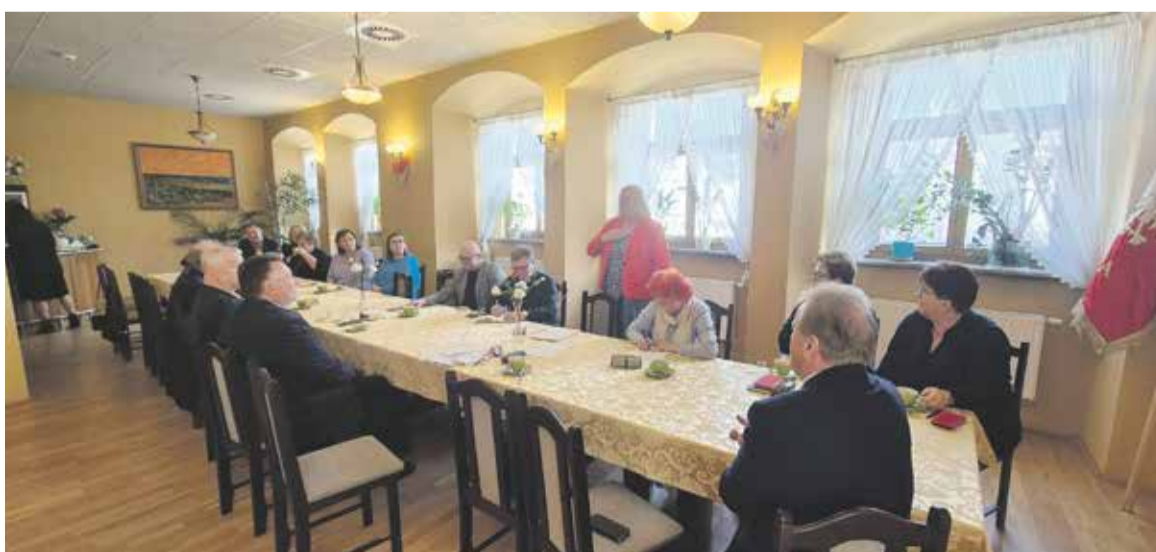
Spotkanie Sekcji Oświaty

W Muzeum Regionalnym mieszczącym się opodal rynku zgromadzono są liczne, również bardzo