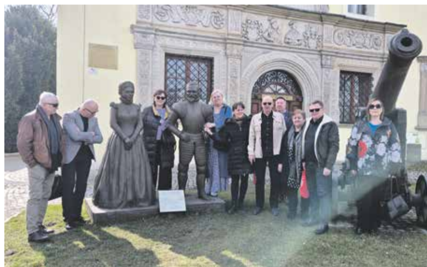
Zwiedzanie chojnowskiego zamku

Rada Krajowa Sekcji Oświaty i Wychowania NSZZ „Solidarność” stanowczo potępia też nieakceptowalną wypowiedź Minister Edukacji Narodowej Barbary Nowackiej,