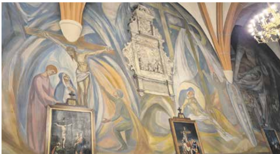
Niecodzienne malowidła w chojnowskiej świątyni

rzadkie eksponaty. Historia muzeum sięga roku 1908 w wyremontowanej Baszcie Tkaczy. W roku 1933 zbiory przeniesiono do Zamku Piastów legnicko-brzeskich. Ten obiekt zbudowany był około 1290 roku. Później był wielokrotnie przebudowywany, często były tu pożary i równie często zmieniali się jego gospodarze.