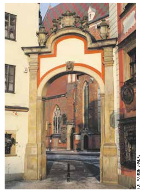
Brama na cmentarzu (dziś nieistniejąca) przy kościele św. Elżbiety