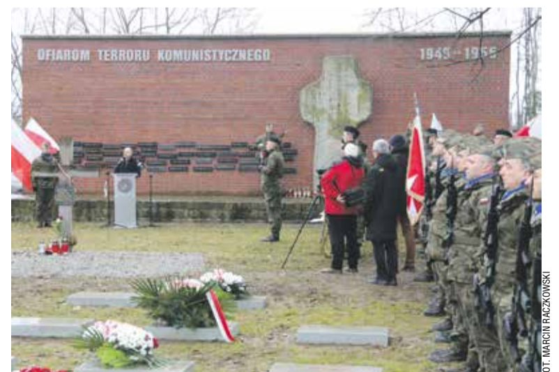
Uroczystości na Cmentarzu Osobowickim

Okręg Dolnośląski Światowego Związku Żołnierzy Armii Krajowej, Dolnośląski Urząd Wojewódzki we Wrocławiu i Centrum Historii Zajezdni, we współpracy z Garnizonem Wrocław. MR