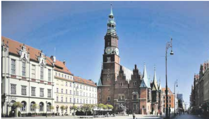
Ratusz we Wrocławiu

Korupcja, cwaniactwo i kumoterstwo władzy od wieków budzi sprzeciw obywateli, którzy raz na jakiś czas manifestują swe niezadowolenie poprzez pisanie petycji, zbieranie podpisów, strajki, uliczne rozruchy czy wreszcie powszechny udział w wyborach.