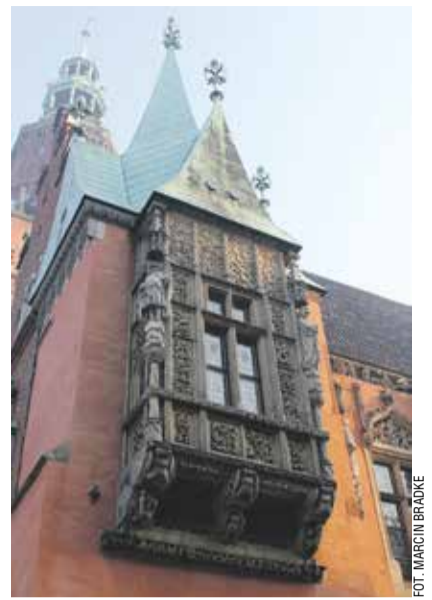
Z sąsiedniego okna wyrzucano rajców

grodowi przez króla Karola Luksemburskiego. Fakt ów dla Korony Czeskiej był wielką obrazą, bowiem miecz ten kładziono na stole jako symbol sprawiedliwości. A tej w końcu stało się zadość, ale o tym za chwilę. Po buncie wybrano nową radę, w skład której weszło kilkunastu przedstawicieli rozmaitych cechów rzemieślniczych. Zwycięzcy poczuli się bezkarni, nie trwało to jednak długo. W roku 1420, a więc w dwa lata po krwawym poniedziałku, kolejny władca Czech – Zygmunt Luksemburski – zawitał we Wrocławiu, wprowadzając tu coś na kształt stanu wojennego. Powołał nową radę miejską, zakazał zgromadzeń do tego stopnia, że nawet rzemieślników spotykających się przy piwie nie mogło być za każdym razem więcej niż sześciu, zakazał też noszenia broni i przechowywania jej w domu. Co jednak najważniejsze – wdrożył śledstwo