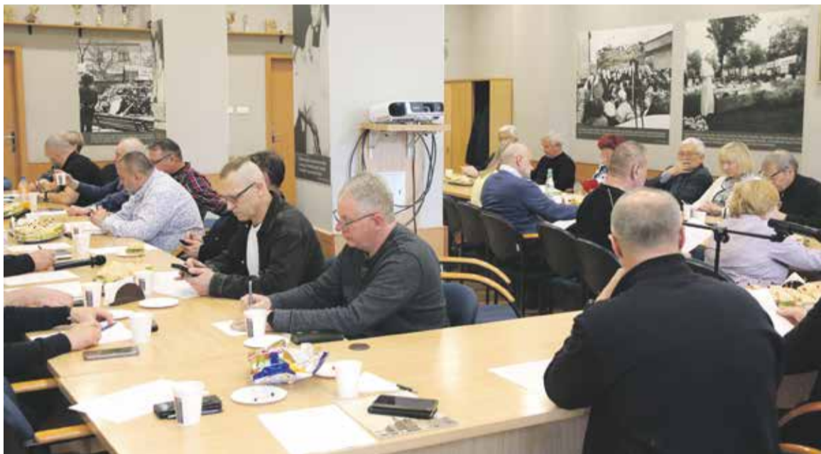
Podczas marcowych obrad działacze omówili sytuację w branżach