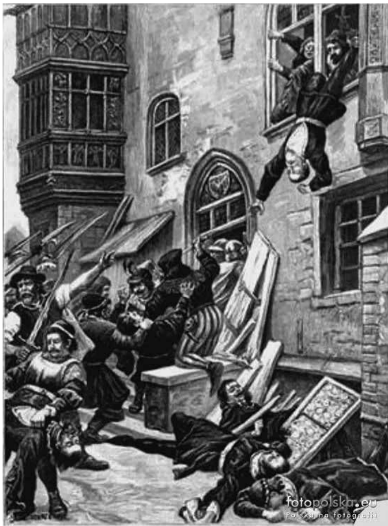
Wrocławska defenestracja rok 1418