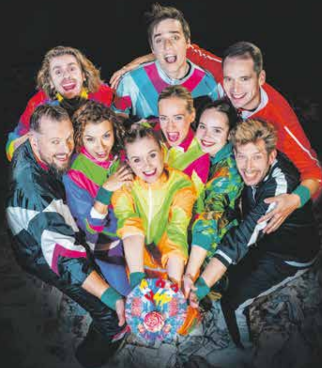
projekt: Tomasz Konieczny