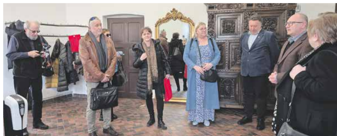
W muzeum w Chojnowie

odkryte w trakcie badań archeologicznych prowadzonych na