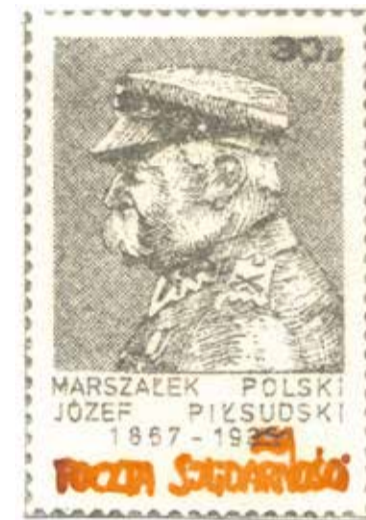
Najczęściej na niezależnych znaczkach pokazywany był marsz. Józef Piłsudski

zobaczyć na znaczkach poczty niezależnej. Są tam wydarzenia związane ze strajkami, z wydarzeniami historycznymi dotyczącymi lat 1956, 68, 70, 76, 80. Najczęściej na znaczkach pojawiają się takie postacie jak Józef Piłsudski, Jan Paweł II, zamordowany ks. Jerzy Popiełuszko, więźniowie polityczni, np. Jan Rulewski, Józef Pinior,