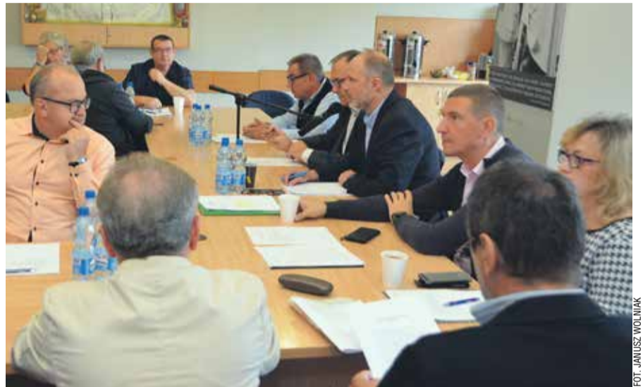
Podczas październikowych obrad Zarządu Regionu