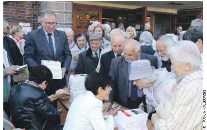
Książka o „strażniku pamięci” cieszyła się wielką popularnością