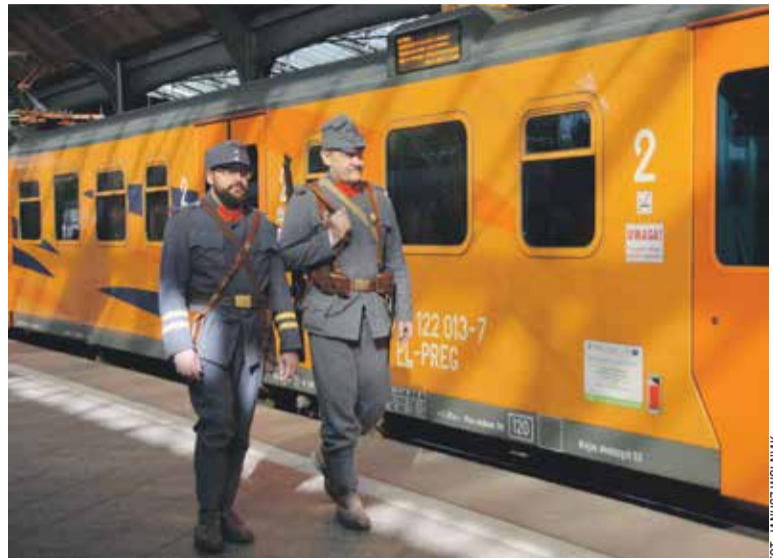
Dworzec Główny PKP pełen był bohaterów z początku XX wieku

– W 2009 roku rozpoczęła się nasza przygoda z historią. W sumie około 30 osób teraz zajmuje się działaniami rekonstrukcyjnymi. Mamy uszyte repliki mundurów austriackich, szaro-niebieskie wzór z roku 1908. Do celów poglądowych dysponujemy też mundurem żołnierza rosyjskiego. Nasza grupa odtwarza 20. cesarsko-królew-