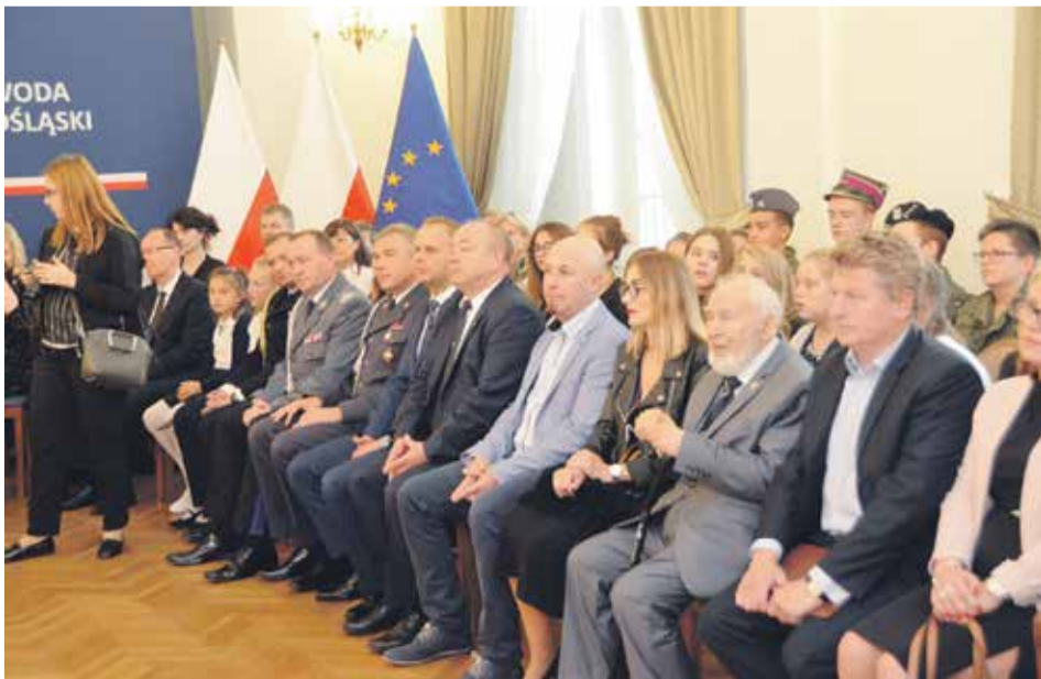
Uroczystość zgromadziła liczne grono kombatanatów i młodzieży