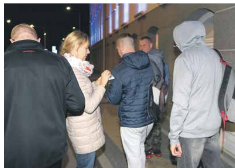
Podczas akcji rozdawania ulotek przed zakładem Ronal

Ronal AG z siedzibą w Härkingen w Szwajcarii jest producentem felg do samochodów osobowych oraz pojazdów użytkowych. Firma zatrudnia ponad 8000 pracowników i produkuje felgi odlewane oraz kute. Firma działa zarówno na rynku oryginalnego wyposażenia, jak i osprzętu do samochodów osobowych i pojazdów użytkowych.