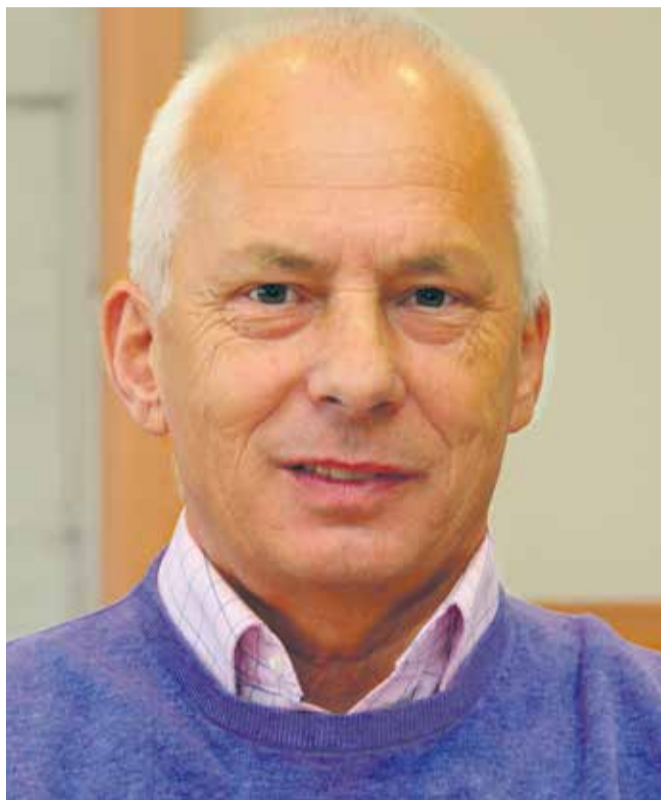
FOT. JANUSZ WOLNIAK

zewnętrzną do wykonania prób hamulców w pociągach. Pojawiły się pogłoski, że podobnie ma być z zespołami manewrowymi. Uwa-