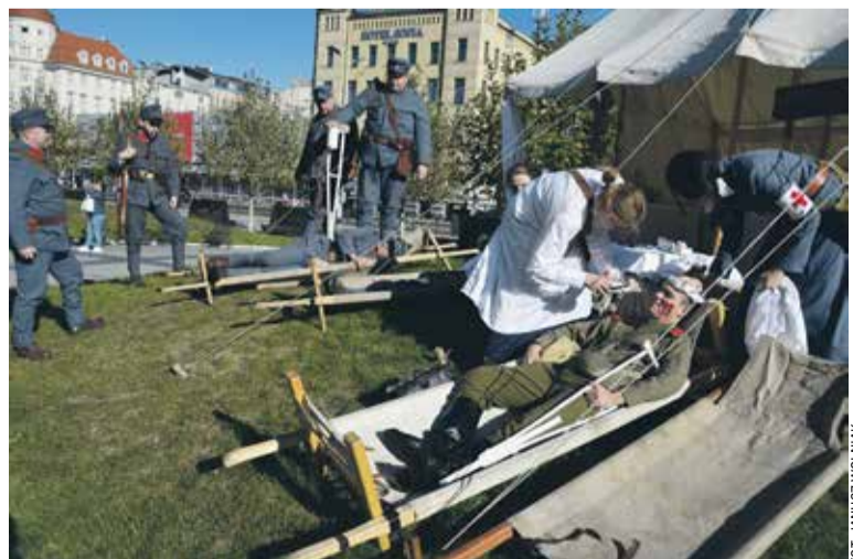
Grupa rekonstrukcyjna z Gorlic przygotowała inscenizację szpitala polowego

Ulu Kochana, jesteśmy z Tobą w tych trudnych chwilach