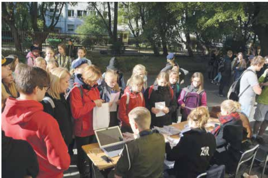
Harcerze rozdawali materiały konkursowe uczestnikom gry ulicznej

Grę Miejską „Orląt cień” zorganizował Dolnośląski Urząd Wojewódzki we współpracy z wrocławskim Instytutem Pamięci Narodowej i Okręgiem Dolnośląskim Związku Harcerstwa Rzeczypospolitej.