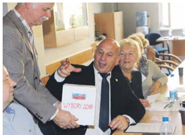
Podczas zebrania wyborczego