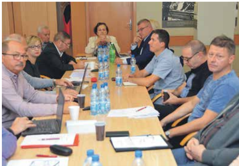
Działacze omówili m.in. sytuację w branżach.