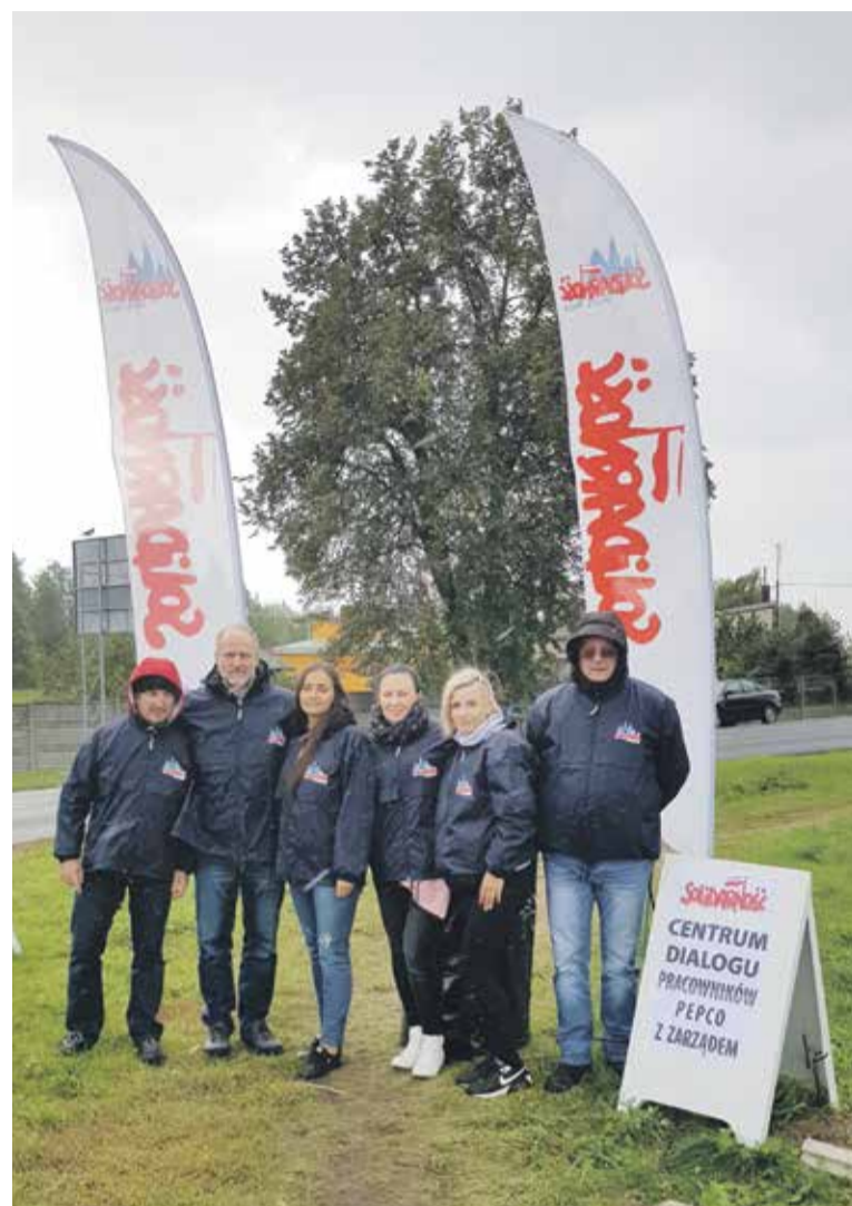
Pod siedzibą PEPCO w Rawie Mazowieckiej