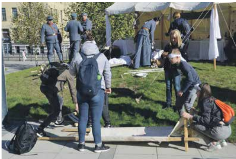
Każda grupa miała do wypełnienia konkretne zadania

szkoły (średniej) podczas zbiórki na boisku Liceum Ogólnokształcącego nr XII przy placu Orłąt Lwowskich otrzymały konkursowe zadania do wykonania. Każda grupa została zaopatrzona w mapkę, zasady gry, zadania i specjalne wydanie biuletynu „Pobudka”.