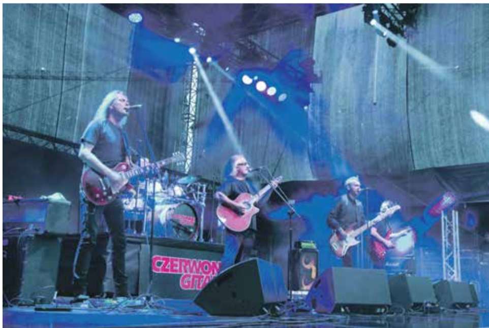
Czerrwone Gitary przypomniły swoje największe przeboje