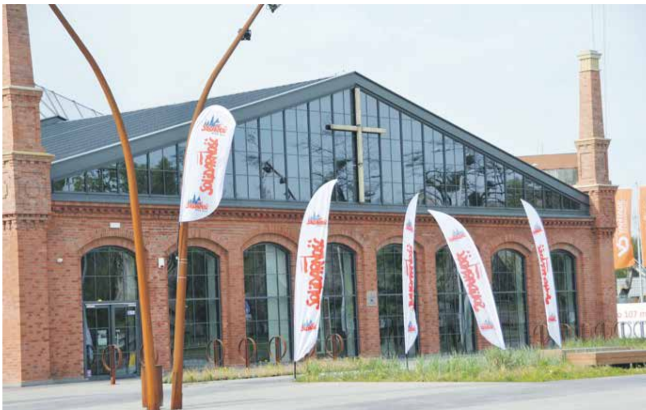
Przed frontem CH Zajezdnia bardzo często pojawiają się flagi Solidarności

Właśnie mijają dwa lata od otwarcia we Wrocławiu Centrum Historii Zajezdnia. Grubo ponad 300 tysięcy osób odwiedziło w tym czasie wrocławski Ośrodek Pamięć i Przyszłość. W niedzielę 16 września odbyły się urodziny ośrodka.