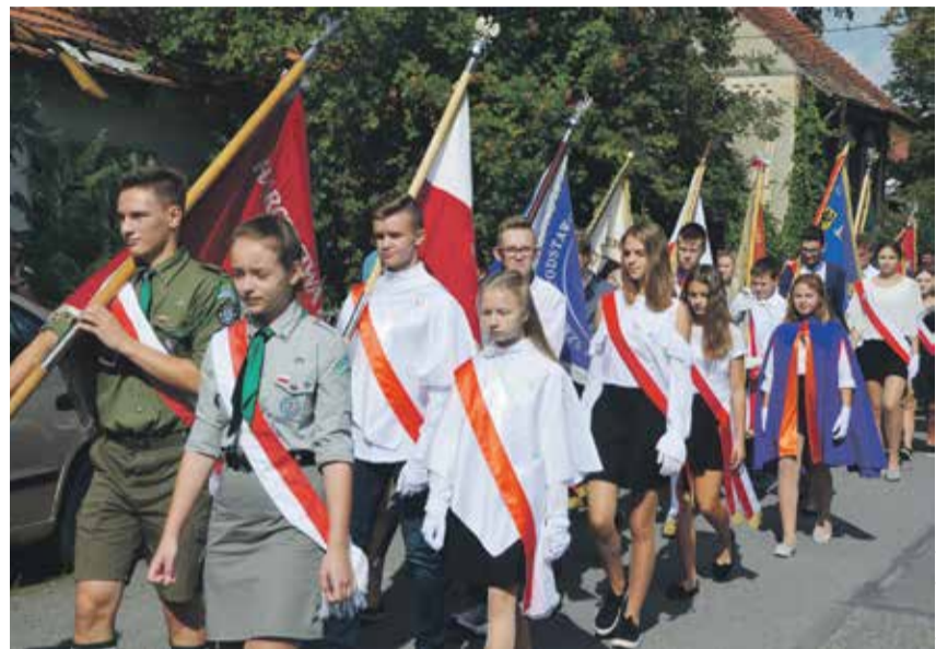
W uroczystościach licznie wzięły udział delegacje szkół wraz z pocztami sztandarowymi