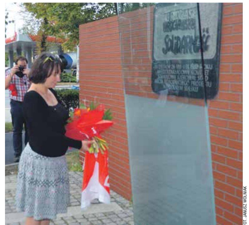
Delegacja związkowców z DGB złożyła wiązankę kwiatów pod historyczną tablicą przy ul. Grabiszyńskiej