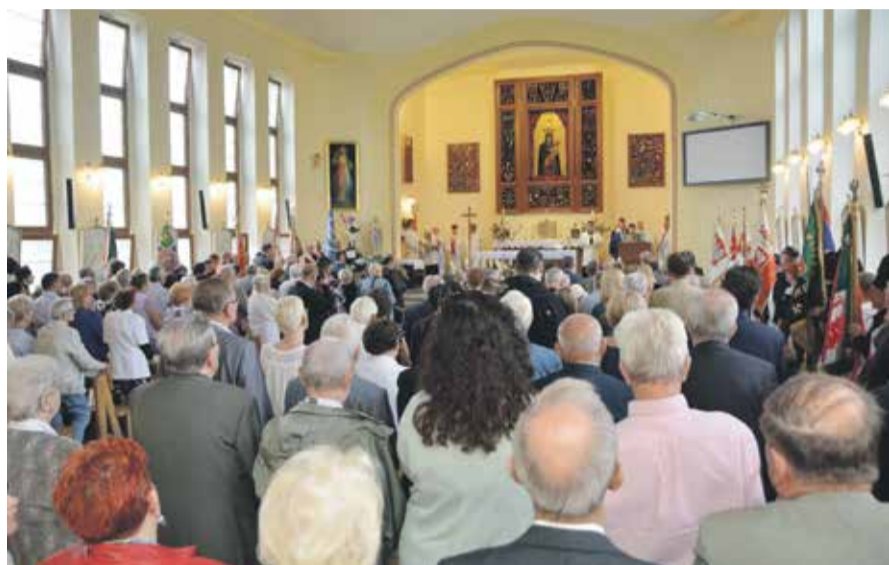
Msza rocznicowa odprawiona pod przewodnictwem bpa A. Siemianowskiego

Kwiaty i zapalone znicze na grobach tych, którzy odeszli, msza w kościele przy Alei Pracy oraz uroczystości przy tablicy upamiętniającej strajk na zajezdni przy ulicy Grabiszyńskiej we Wrocławiu. W taki sposób uczcili 26 sierpnia br. członkowie dolnośląskiej Solidarności rocznicę powstania Związku.