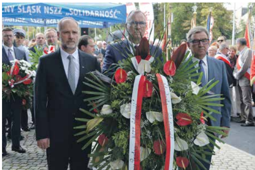
Przedstawiciele Regionu złożyli hold pod tablicą upamiętniającą narodziny dolnośląskiej Solidarności.