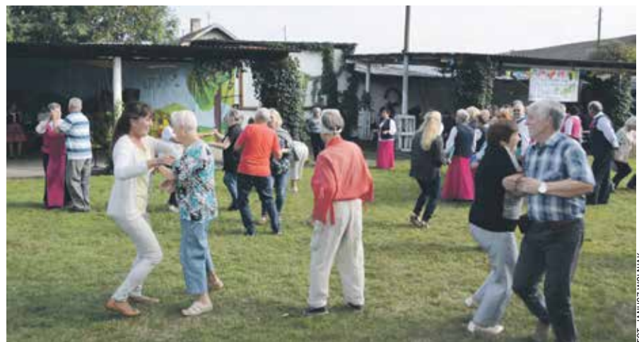
Po południu przy muzyce regionalnych zespołów kresowiacy weselo się bawili

Obecny na uroczystościach ks. Zbigniew Słobodecki, kapelan środowisk kresowych, przypomniał o mię-