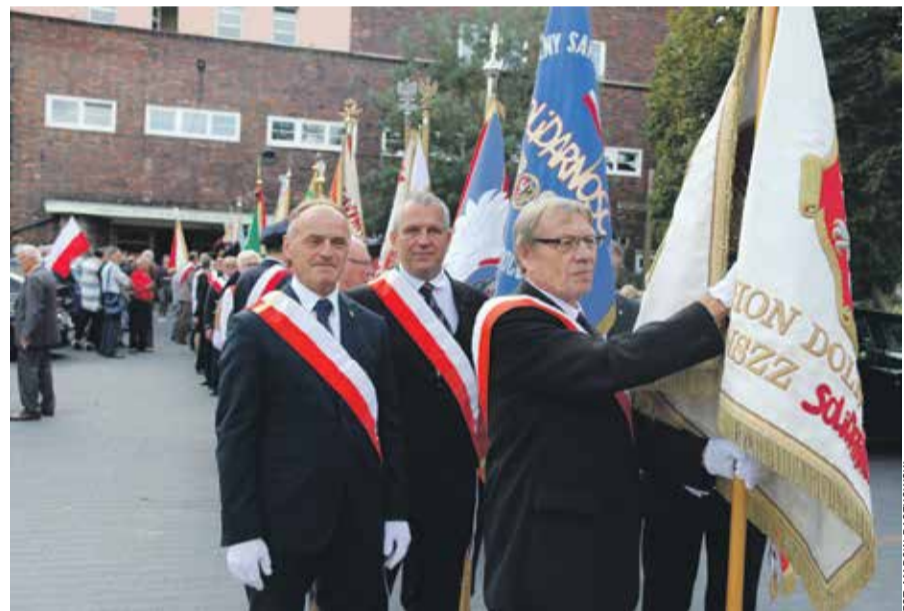
W uroczystym dniu licznie stawiły się delegacje z sztandarami

Piknik na terenie Centrum Historii Zajezdni był okazją do towarzyskich spotkań, wspomnień i dobrego spędzenia czasu. Wieczorem, w ramach świętowania