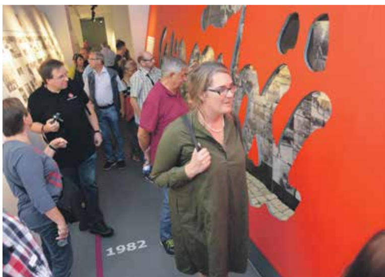
Z wielkim zainteresowaniem niemieccy przyjaciele oglądali wystawę Solidarności w CH Zajezdnia