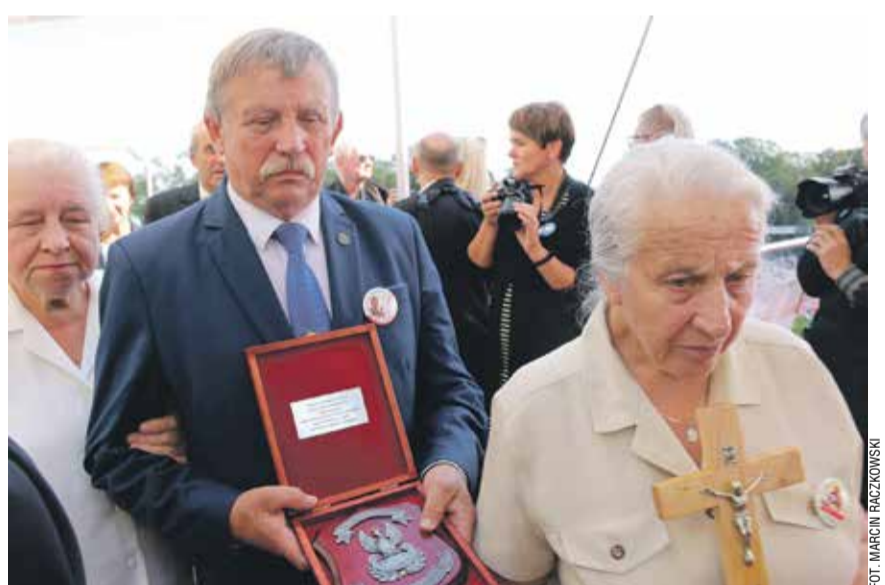
Rodzina bł. ks. Jerzego Popiełuszki

była nie tylko wymodlona i wywalczona i wydyskutowana, ale, co powtarzam wielokrotnie, była też wypracowana. I nie przedstawiamy oprócz modlitwy, oprócz debaty dodawać pracę solidną, rzetelną, uczciwą do zasobów Ojczyzny, narodu, polskiego domu i polskiej ziemi, nawet jeśli jest to niewielka firma, niewielka część. A gdy jest krzywda komuś czyniona, niech ten ktoś nie zostaje sam. W solidarności międzyludzkiej i społecznej, kto jest głodny, ma prawo otrzymać chleb, kto jest chory, ma prawo otrzymać lekarstwo i pomocną dłoń, kto jest skrzywdzony prawniczo czy ekonomicznie, ma prawo otrzymać pomoc prawną i ekonomiczną,