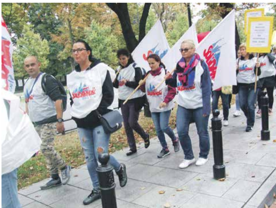
Liczne grupy z całej Polski, w tym z Dolnego Śląska, zmierzały do siedziby MEN

Okolo pięciu tysięcy związkowców, w tym grupa oświatowa z Dolnego Śląska, pod hasłem „Czerwona kartka dla pani minister”, protestowało 15 września przed gmachem Ministerstwa Edukacji Narodowej.