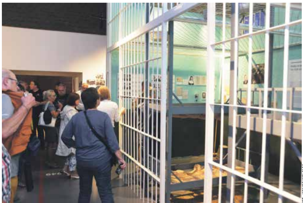
W jednej z sal można zobaczyć więzienną celę