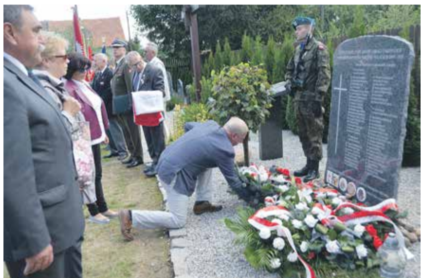
Przed tablicą poświęconą pomordowanym księżom składano kwiaty i stanęła honorowa warta wojskowa

ków ziarnem dla młodych świadków historii , znalazły się na tablicy herby donatorów – Gminy Siechnice, Gminy Żórawina, Rady Lokalnej nr 15947 w Miliczu, Towarzystwa Miłośników Kultury Kresowej oraz 27. Dywizji Wołyńskiej AK.