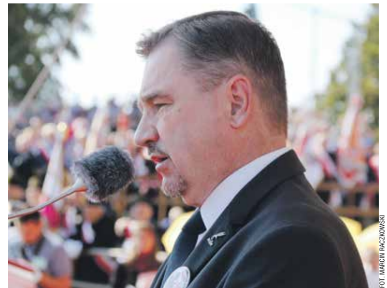
Przed mszą do zebranych przemówił Piotr Duda

jego słynnych słowach na Placu Zwycięstwa, wierni odśpiewali „My chcemy Boga”. My dzisiaj też, jako ludzie Solidarności, tutaj na wzgórzu jasnogórskim, w trudnych momentach naszej Ojczyzny, gdzie są ataki na Kościół katolicki, są ataki na wartości, takie jak rodzina, musimy z tego wzgórza głośno powiedzieć „My chcemy Boga, my poddani”. Szczęść Boże Polsce, szczęść Boże Solidarności – zakończył Piotr Duda.