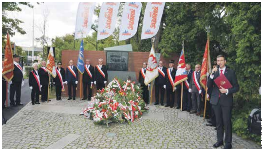
Jak co roku tablica tonęła w kwiatkach