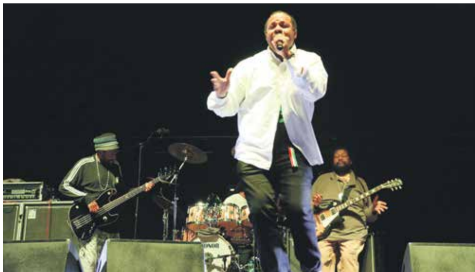
Inner Circle – największa gwiazda drugiego dnia

Od września do grudnia w holu Zarządu Regionu na pl. Solidarności 1/3/5, I piętro będzie można oglądać wystawy poświęcone 100-leciu niepodległości. Pierwsza ekspozycja już jest otwarta dla zwiedzających, a druga – „Sto twarzy Niepodległości” będzie eksponowana od połowy października. Zapraszamy.