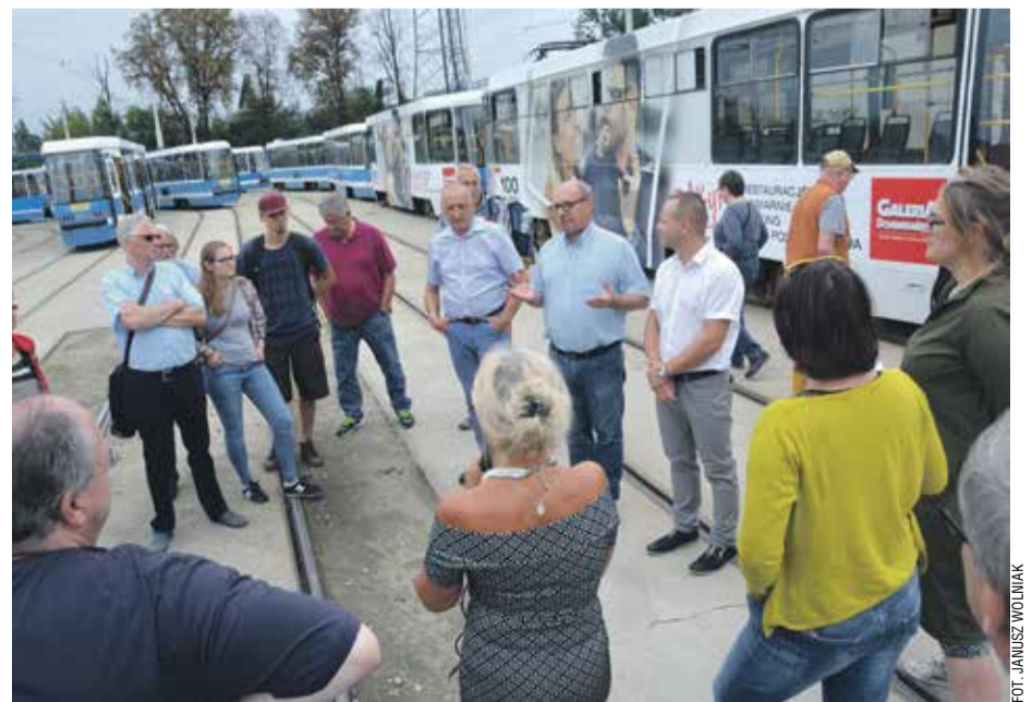
Goście z Niemiec mieli okazję poznać historię i współczesność zajezdni tramwajowej przy ul. Słowiańskiej