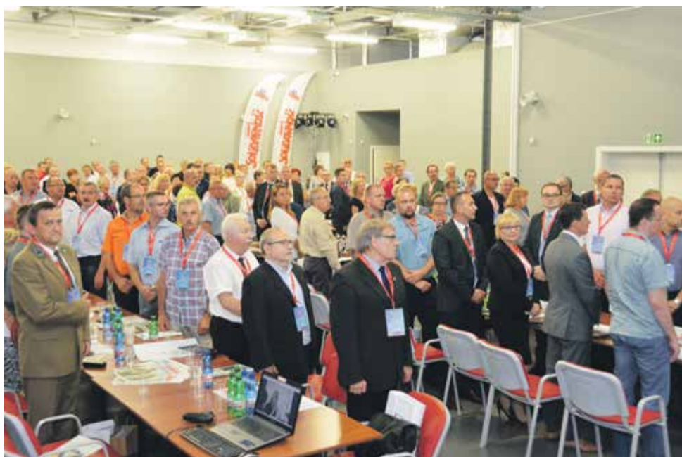
W Zajezdni odbywało się też Walne Zebranie Delegatów Regionu