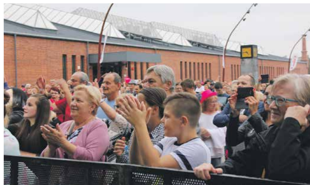
Fani przy barierkach oczekiwali na artystów