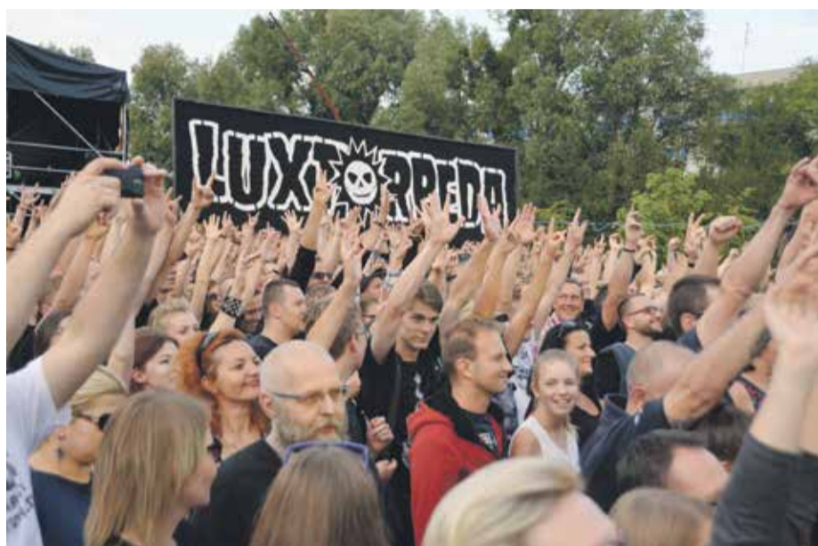
Publiczność gorąco przyjęła występy zespołów na tegorocznym koncercie wRock for Freedom