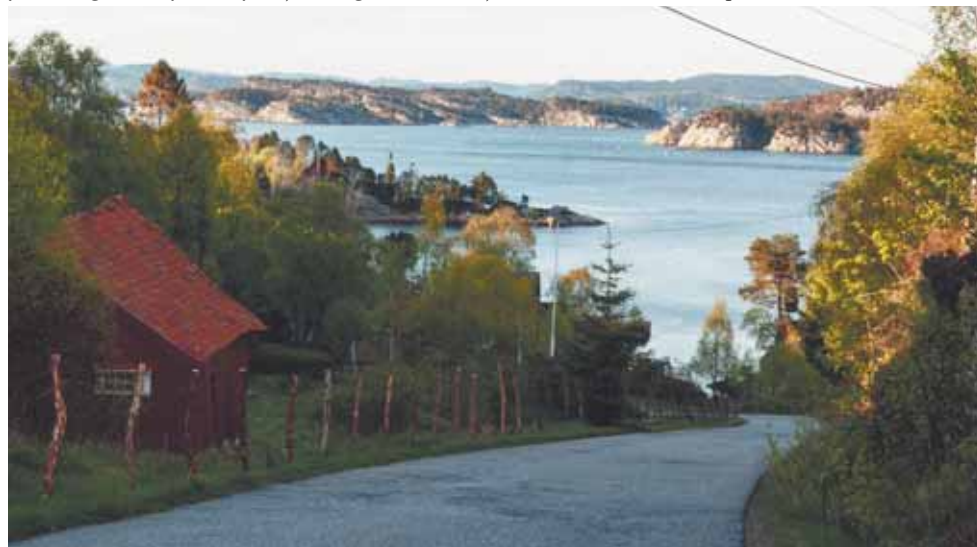
Kraj o pięknym krajobrazie i atrakcyjnym socjalu jawi się w oczach Polaków jako bardzo atrakcyjny do pracy. Niestety, bywa, że za swój wybór płać wysoką cenę.

Stąd: Norwegom trudno zrozumieć polską mentalność, dla nich „rozkrzyczana” – niczym dla nas sposób bycia Włochów. O różnicach temperamentów mówi się