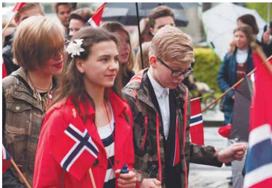
FOT. DOROTA NIEDZWIĘCKA

szość hucznie i radośnie świętuje podczas organizowanych z wielką pompą miejskich imprez. Z drugiej strony panuje w nich przekonanie, że władza państwowa „wie lepiej” i że to ona określa moralność. Norwegia od kilkuset lat jest krajem protestanckim, co przekłada się w praktyce na coś, co jest zupełnie obce krajom katolickim: łączenie władzy państwowej z władzą re-