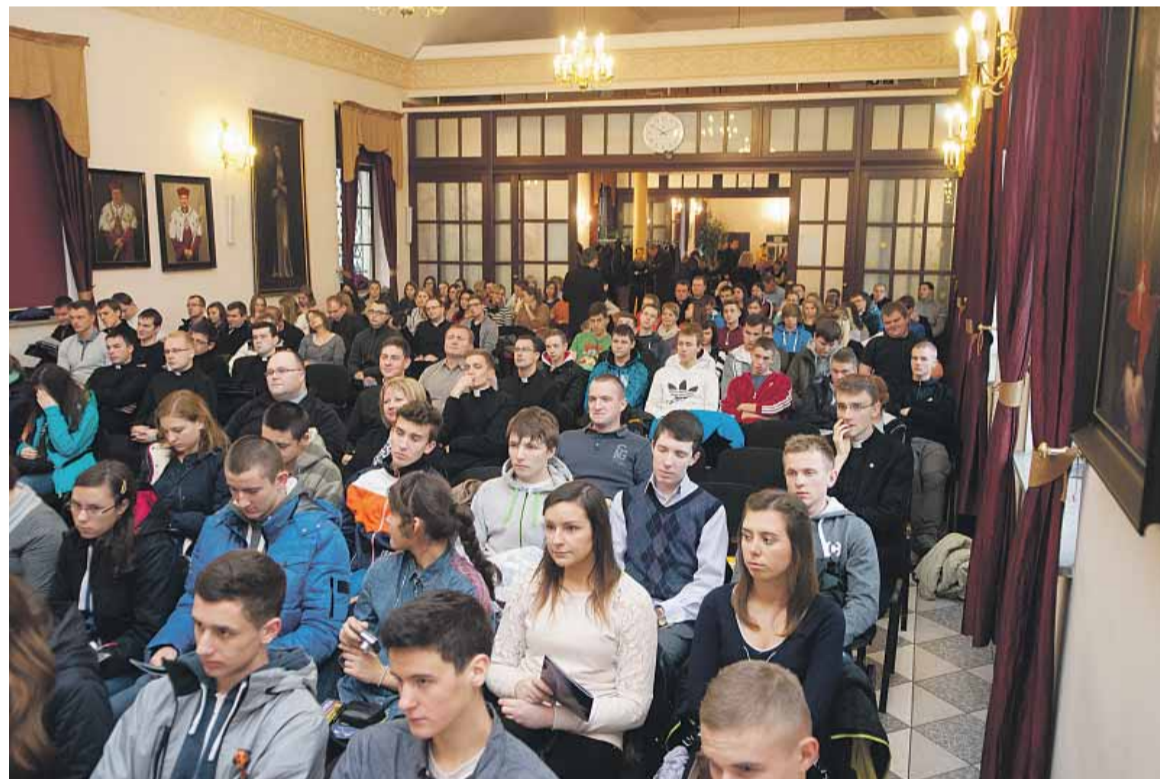
To od naszej postawy i inicjatyw zależy, jak w przestrzeni społecznej odnajdzie się młode pokolenie. Na zdjęciu: Młodzi podczas jednego z wykładów o klasycznych wartościach.

Lub pracować nad sobą: nad tym, by realizować obiektywne war-