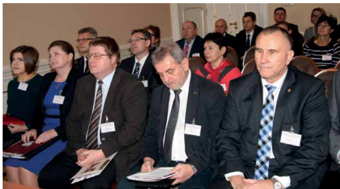
Konferencja odbyła się pod patronatem Komisji Krajowej NSZZ „Solidarność” i Głównej Inspekcji Pracy