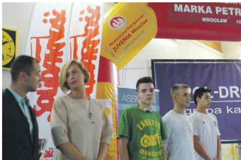
Otylia Jędrzejczak gratulowała młodym sportowcom