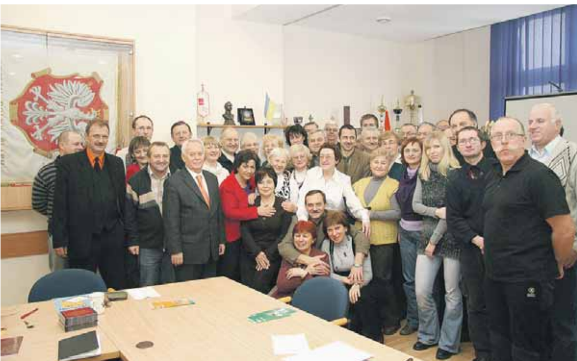
Zdjęcie grupowe na zakończenie roku szkoleniowego 2009