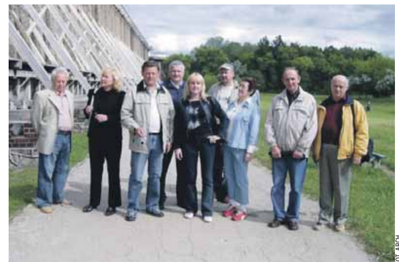
Wyjazdowe seminarium Wszechnicy SIP