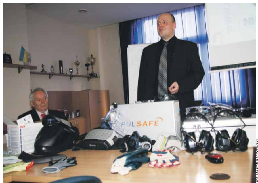
Podczas spotkań Wszechnicy prezentowane były najnowsze trendy ze świata BHP

tematycznych, które umożliwiają szerokiej społeczności inspektorów zdobywanie wiedzy z zakresu dynamicznie nowelizowanego prawa pracy. Przynależność do Wszechnicy umożliwia słuchaczom dostęp do materiałów szkoleniowych i instruktażowych. Pozwala na wymianę doświadczeń z inspektorami sektorów branżowych. Dzięki temu mogą oni skuteczniej realizować