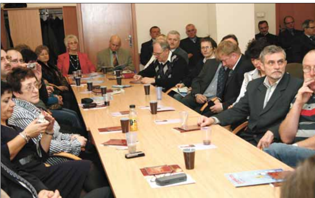
Dowodem uznania dla działalności Wszechnicy jest przyznanie jej w 2004 r. prestiżowej nagrody im. H. Kraheleskiej

W miarę dalszego rozbudowywania i doskonalenia systemu ochrony pracy stymulującego przy pomocy samoczynnie działających instrumentów pracodawcy będą zmuszeni do stałej poprawy i utrzymywania nale-