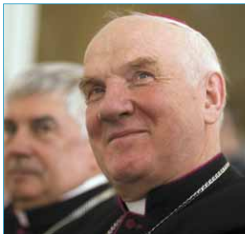
Bp. Ignacy Dec

ligii w życiu społecznym. Lansują perwersje i dewiacje moralne: aborcję, eutanazję, narkomanię, alkoholizm, homoseksualizm, permisywizm itd. – Zwolennicy etycznego liberalizmu chcą wyzwolnić człowieka od wszystkiego, co go ogranicza, co zmusza do wysiłku, ofiary, poświęcenia. Lansują więc wolność negatywną, wolność „od”, pomijając całkowitym milczeniem wolność po-