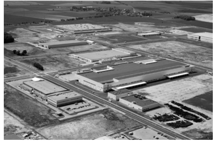
Strefa Ekonomiczna Biskupice Podgórne

Serdecznie dziękujemy Dział Rozwoju Związku