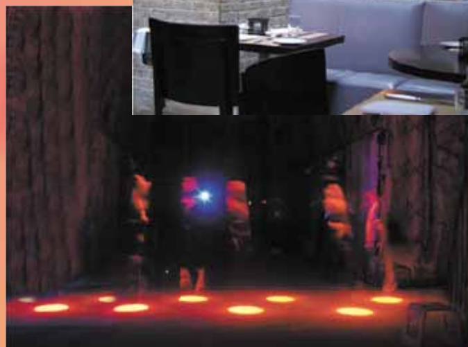
Wielofunkcyjna sala spotkań służąca jednocześnie jako scena, studio nagrań, miejsce do projekcji filmów, koncertów i organizacji konkursów