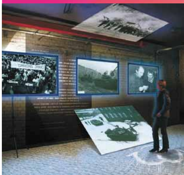
Multimedialna „ściana pamięci”, wystawy stałe i czasowe prezentujące działalność podziemną lat 80.

Podziemie jest organizowane przez członków i sympatyków Stowarzyszenia Solidarność Walcząca , ludzi, dla których bezpłatna, ofiarna działalność na rzecz dobra wspólnego stanowi znaczącą część drogi życiowej. Ośrodek otwarty jest jednak na wszystkie organizacje i środowiska, którym bliski jest dorobek polskiej „Solidarności”.