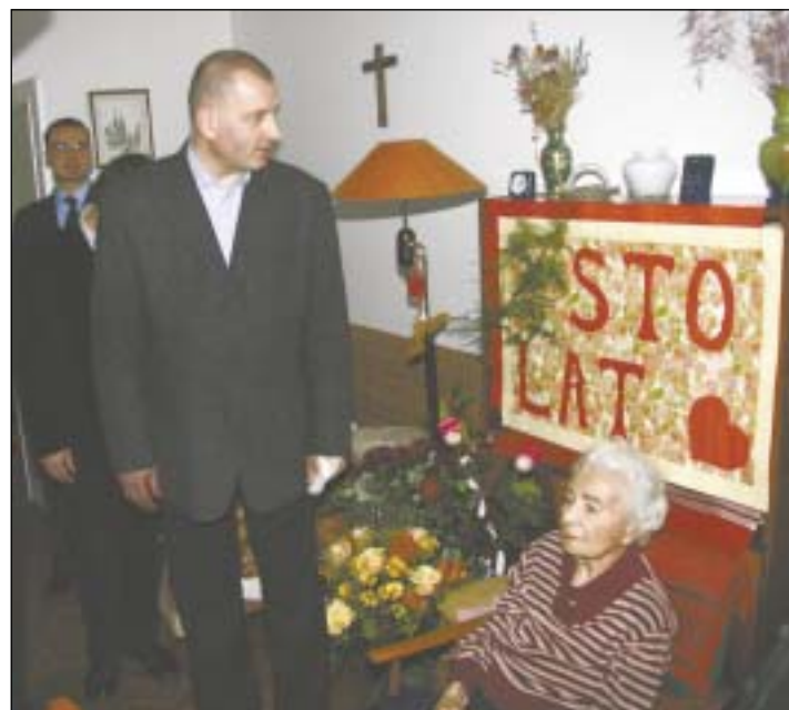
Prezydent Dutkiewicz złożył życzenia urodzinowe