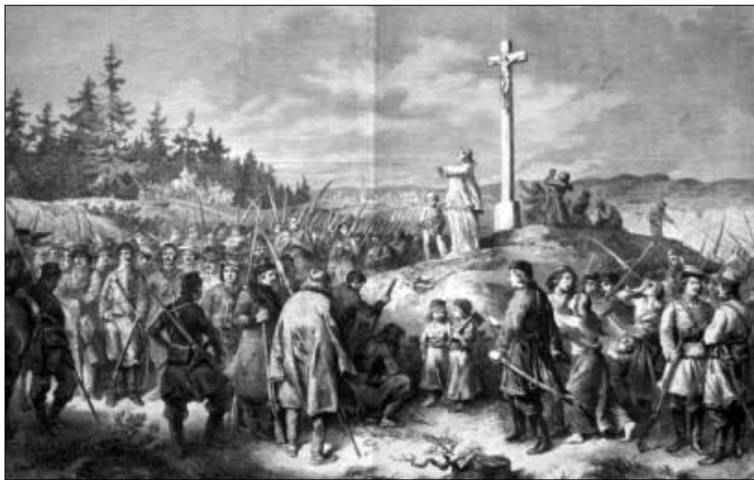
Błogosławieństwo powstańców. Rycina nieznanego autora z XIX w.

Nastąpiła zatem całkowita sprzeczność między dążeniami rosyjskimi a polskimi. My chcieliśmy przynajmniej pełnej autonomii i marzyliśmy w konsekwencji o odzyskaniu niepodległości, podczas gdy Rosja przyznawała nam zaledwie część uprawnień, a o niepodległości nie mogło być mowy. Sytuacja przed wybuchem powsta-