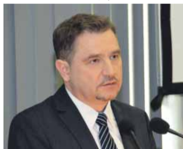
Przewodniczący Piotr Duda

damność” Piotr Duda zwrócił m.in. uwagę na to, że jeszcze niedawno „Solidarność” była osamotniona w swoich poglądach na temat negatywnego wpływu form zatrudnienia na dobro pracownika, a dzisiaj różni eksperci i sam premier Tusk mówi o obdzieraniu pracownika z jego godności. Uzmysłowił też zebranym, że Polska jest w Europie liderem w zawieraniu tzw. umów śmieciowych, a przez to ograniczone są perspektywy pracy młodych ludzi. Mówił też o presji w stosunku do pracodawców, którzy respektują reguły kodeksu pracy.