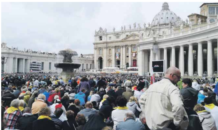
Podczas mszy kanonizacyjnej na placu św. Piotra w Rzymie