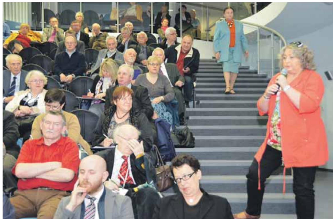
W trakcie konferencji głos zabierali też związkowcy siedzący na widowni.

Jan Paweł II w encyklice Laborem Exercens (O pracy ludzkiej), pisał: „Praca wyróżnia człowieka wśród reszty stworzeń, których działalności związanej z utrzymaniem życia nie można nazwać pracą – tylko człowiek jest do niej zdolny i tylko człowiek ją wykonuje, wypełniając równocześnie pracą swoje bytowanie na ziemi. Tak więc praca nosi na sobie szczególnie znamię człowieka i człowieczeństwa”.