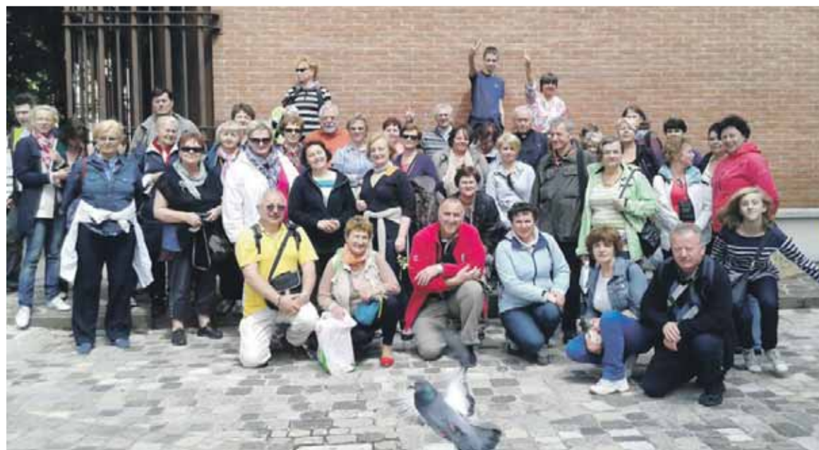
Pamiątkowe zdjęcie uczestników pielgrzymki