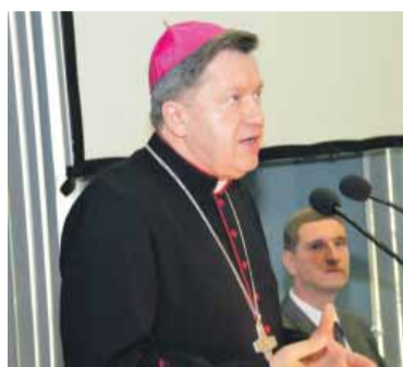
Abp Józef Kupny

wystąpieniem metropolita wrocławski abp Józef Kupny, podkreślając, że praca ludzka ma zawsze wymiar społeczny i musi ona zawsze służyć dobru człowieka.