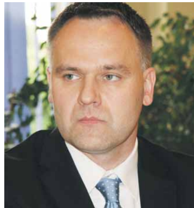
FOT. MARGIN RACZKOWSKI

Będziemy domagać się wyrównania dopłat bezpośrednich dla naszych rolników. Politycy PSL są w tej kwestii bezwolni. Ale najważniejszą sprawą jest przesunięcie uwolnienia terminu obrotu polską ziemią. Nie godzimy się na to, aby od