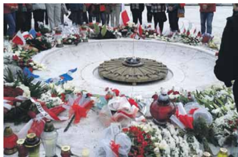
Cmentarz Monte Cassino – miejsce pamięci