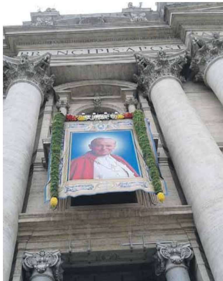
Oficjalny portret św. Jana Pawła II

przepiękne krajobrazy Republiki San Marino, wnętrza cudownych świątyń, np. Bazyliki Santa Casa czy Katedry Duomo.