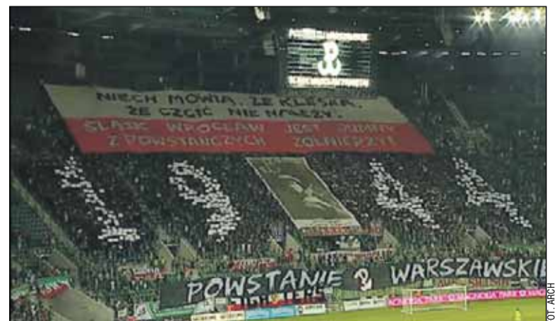
Oprawa meczu wykonana z okazji rocznicy wybuchu Powstania Warszawskiego. Wcześniej kibice Śląska przygotowali m.in. oprawę poświęconą Żołnierzom Wyklętym oraz rotmistrzowi Witoldowi Pileckiemu.